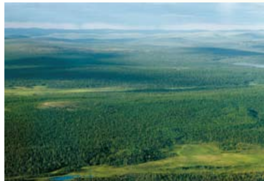
doc. Réseau Pro - Panofrance

En effet, cette certification décernée par le FCBA vient couronner un engagement fort en matière d'environnement et de transparence. Ainsi les 81 agences spécialistes bois/panneaux des enseignes Réseau Pro, Coverpro, Panofrance, Meyer et Bonnichon proposent désormais des produits bois 100 % PEFC pour les essences de feuillus et de résineux, dans toutes les familles de produits :